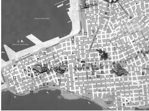
A. Plano de Montevideo (Uruguay)

Gráfico 2: Observa los planos urbanos que te presentamos a continuación y responde a las siguientes preguntas. (20 puntos)