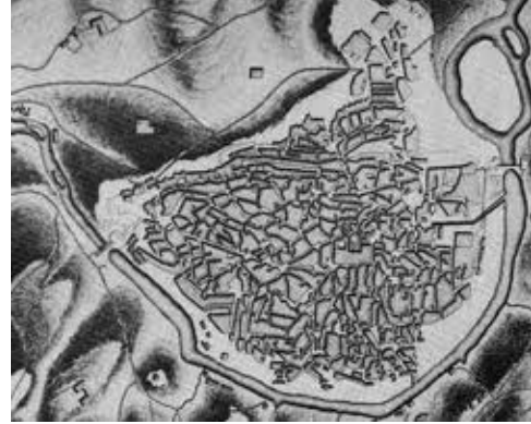
B. Plano de Toledo (España)

15. Indica qué tipo de plano urbano tiene cada ciudad (4 puntos)